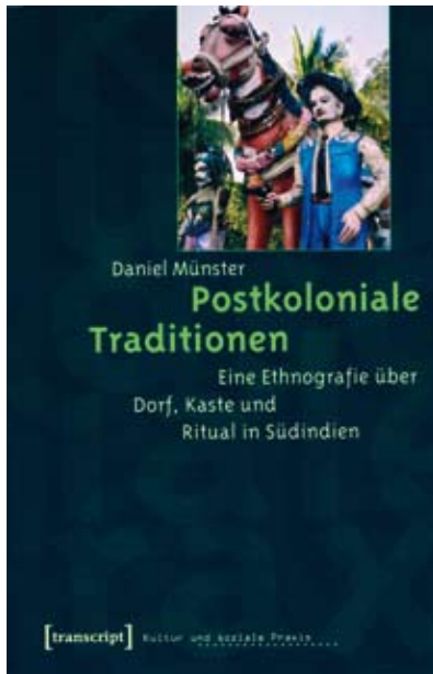
Daniel Münster, Postkoloniale Traditionen. transcript Verlag: Bielefeld 2007

spezifische Lokalität detailliert in ihrer Komplexität und gegenseitigen Abhängigkeit beschrieben zu sehen. Ein Index wäre hilfreich gewesen.